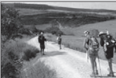
Op de Camino